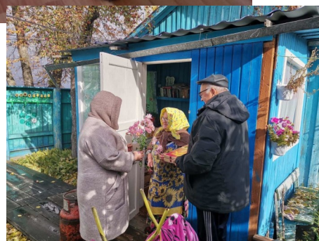
Дорогие наши учителя!